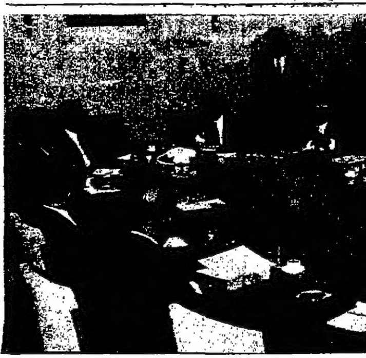
جانب من المحادثات التي جرت صباح أمس بين الوفدين الأردني-ليبيا برئاسة السيد ببعث التهانوي رئيس الوزراء والليبي برئاسة السيد عبد الحميد البكوش رئيس الوزراء